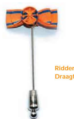
Ridder 3° Klasse Draagteken