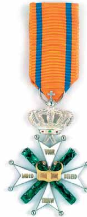
Ridder 4° Klasse