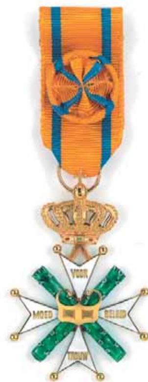
Ridder 3° Klasse

In het hart der kruisen ligt aan de achterzijde een blauw geëmailleerd medaillon met de gouden letter 'W', omvat door een gouden lauwerkrans. De 'W' verwijst naar de insteller, Koning Willem I. Voor de Ridders der 4 e Klasse is het kruis in zilver uitgevoerd, 42 millimeter groot. Voor Ridders der 3 e Klasse in goud met een zelfde middellijn, aangevuld met een rozet op het lint.