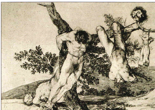
Afb. 1: Francisco Goya: harde tekeningen. Bedoeling: aanklacht tegen de Fransen.